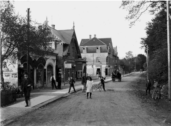
Holte Stationsvej 1907