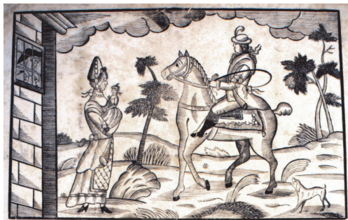
Den Stormagtige Dronning Caroline Mathilde til Søf.