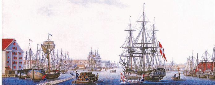
Handelsskibe tilhørende de Coninck

Et foredrag om Danmark i Verden - om Danmarks storhed og fald - om Danmark som indvandrerland .....i 1700-tallet.