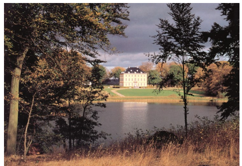
Næsseslottet, set fra Luknam/Kaninholmen, oktober 1997