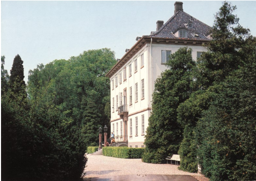
Næsseslottet set fra øst, ca. 1970

På den forhåbentlig smukke majaften skal vi besøge Næsseslottet og gå i den omgivende park. Næsseslottet, der blev opført i 1782-1783 af Frédéric de Coninck, ligger stadigvæk utrolig smukt i parken, som oprindeligt var en af sin tids enestående romantiske have med lysthuse, grotter, monumenter og med udsigt til Furesøen