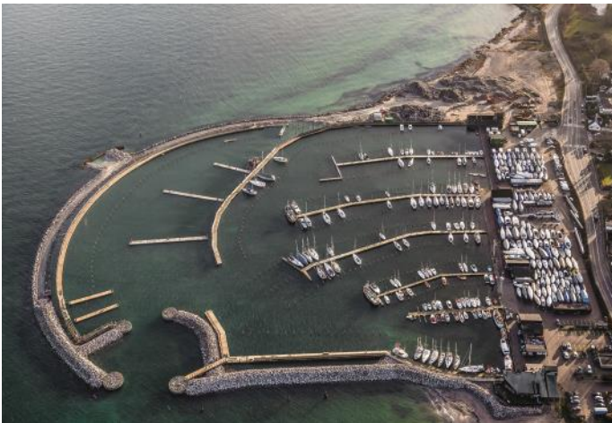
I 2013-15 bliver havnen igen bygget ud, og nu bliver hele det gamle havneanlæg omkranset af en ny østmole, og indsejlingen bliver suppleret med et for-bassin, der sikrer at vandet i havnen er meget roligt. Stenmolerne forhøjes - og bliver dermed klimasikret, og der bliver plads til ca. 570 både i havnen.