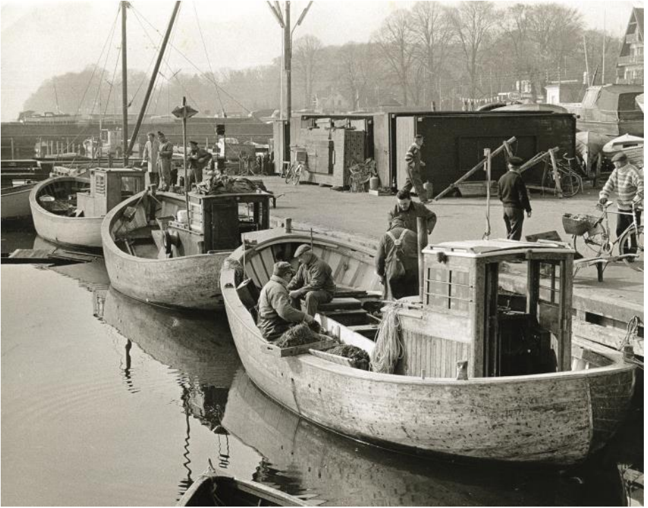
Fiskernes "hjørne" en sommerdag i 1969. Fiskernes skure til fangstredskaber i midten af billedet og "Villa Rosenhøj" yderst til højre.