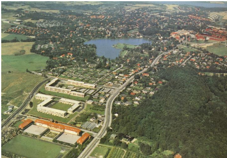
Postkort: Bistrupskolen, Bistrup Park, Skovgårdsparken og villaområderne - set mod Birkerød Sø i 1960-erne

Sognerådsformændene blev borgmestre ved den såkaldte "Gentofteordning" i 1952 og markerede på den måde kommunernes overgang til forstadsstatus og bymæssigt bebyggede kommuner.